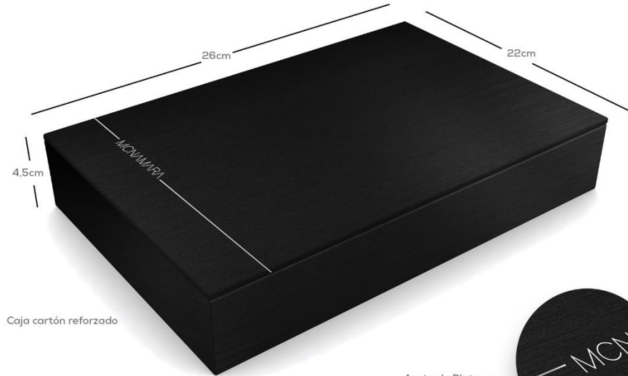
Caja cartón reforzado

Acabado Plata en líneas y nombre, o con UV.