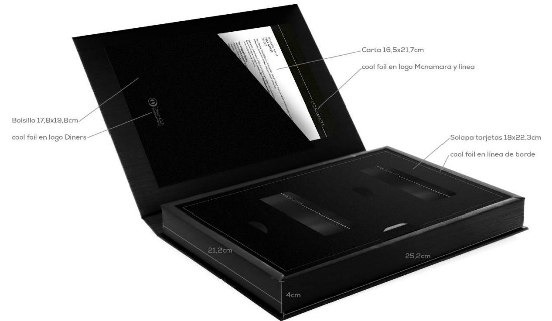
Bolsillo 17,8x19,8cm cool foil en logo Diners